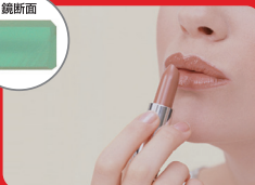
銀引きミラー (当社比)

従来のガラスは、鉄分を多く含むため入射光の青が吸収されるため白色がくすんで見えます。そこで鉄分をより多く取除いた透明なガラスを採用したナピュアミラーを開発しました。色の変化が少なく、ガラスの色に影響されない自然で純粋な色表現により、ファンデーションを合わしたりポイントメイクをするのに最適です。※鏡の映り方の写真は、イメージです。