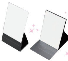
PRO MODEL MIRROR PREMIUM