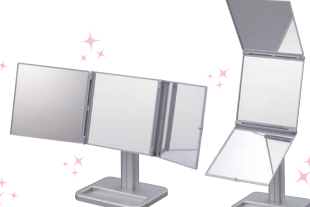
PERFECT STYLE 3WAY MIRROR