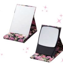
X5 ZOOM-UP PRO MODEL MIRROR