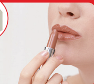
ナピュアミラー (当社比)