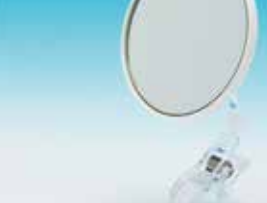
3倍、5倍拡大鏡の2タイプ

過度な力を加えたり無理な方向へ曲げたりすると破損の原因になりますので、お気を付けてください