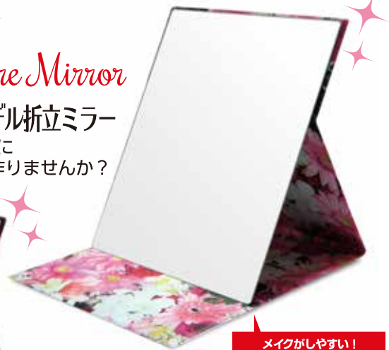
プロモデル折立ミラー (L)