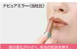
色の変化が小さく、本当の肌色を映す。