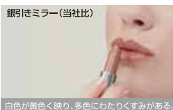
白色が黄色く映り、多色にわたりくすみがある。