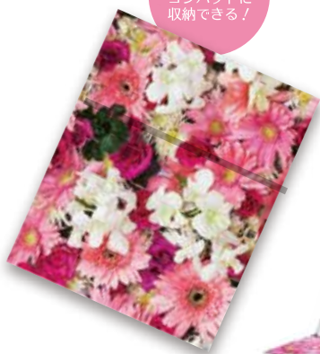
プロモデル折立ミラー (S)

ナピュア オリジナルデザイン・プロモデル折立ミラー 人気のプロモデル折立ミラーに オフセット印刷をしてオリジナル商品を作りませんか？