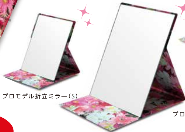
プロモデル折立ミラー (M)