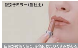
白色が黄色く映り、多色にわたりくすみがある。