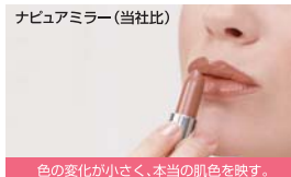
色の変化が小さく、本当の肌色を映す。