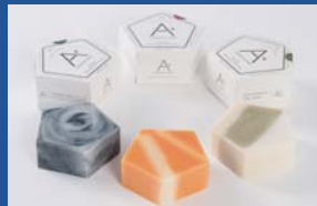
株式会社大阪エース ANSWERSOAP