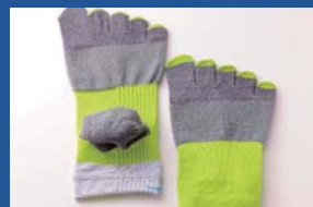
コーマ株式会社 高機能3Dソックス FOOTMAX (3D SOX)