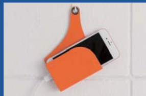
ゲンクリエイティブ YURIKAGO (ユリカゴ)