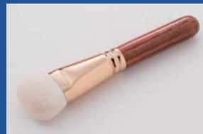
株式会社ウエダ美粧堂 BISYODO ファンデーションブラシ