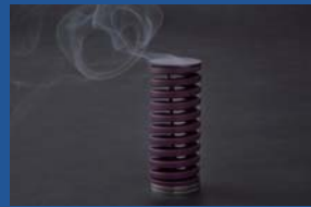
中辻金型工業株式会社 ゆらり 1/f Incense Holder