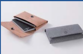
合同会社アルルカンプロダクト Business Card Holder 2Pockets シームレス名刺入れ2ポケット