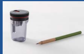
株式会社中島重久堂 つなぐ鉛筆削り「TSUNAGO」