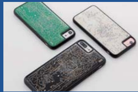
株式会社電子技販 FLASH 関西回路線図 iPhoneケース