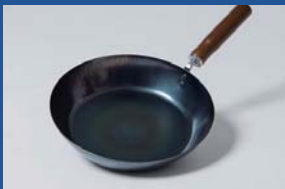
藤田金属株式会社 フライパン物語