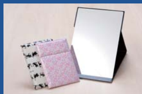
堀内鏡工業株式会社 ナビュアミラー プロモデル折立ミラー