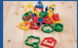
有限会社アイ・シー・アイ デザイン研究所 nocilis(ノシリス)