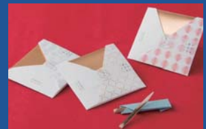
菊水産業株式会社 純国産黒文字ようじ nocilis(ノシリス)