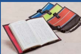
サンワード株式会社 ハンドルブックカバー らうらうじ -second hose-