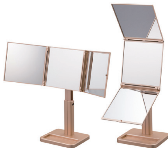
▶ 角度を自在に調整でき、頭頂部や襟足も見やすい「パーフェクト3WAYミラー」。