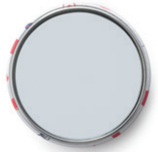
裏面 ナピュアミラー®