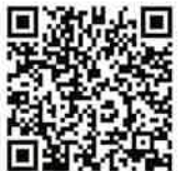
▲소싱페어홈 페이지는 여기에서

코엑스 내 별도 행사장에서는 12월 4일부터 6일까지 3일간 국내 최대 규모의 소비재 전문 전시회인 '소싱페어'가 개최됩니다. 한국 기업과의 거래, 한국 시장 진출을 고려 중이신 분들께서는 방문해 보시길 추천드립니다.