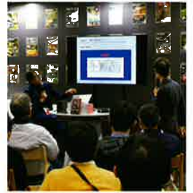
▲일본 시장 개척을 위한 힌트를 얻으세요.

전시회 기간 중인 이틀동안 행사장 내에서는 다양한 세미나를 개최하여, 방문하시는 바이어님들이 일본 시장을 이해하고 일본 진출의 계기가 될 수 있는 기회를 제공합니다. 또한, 참가기업의 제품을 직접 볼 수 있는 전시 이벤트를 진행하여 방문객들의 상담 기회를 촉진할 것입니다.